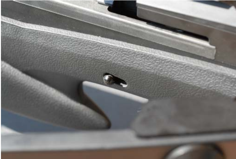
Sicherungshebel beidhändig mit Daumen erreichbar

Aber halt ... da ist noch mehr ... das ist etwas, was man schnell im Umgang vergisst. Die Mischung des Designs ist eher unkonventionell und zunächst ziemlich erschreckend, aber wieder gibt es einen Grund, und zwar einen guten: Balance!