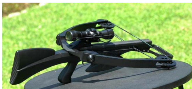
Durchgehend Spitzenqualität bis ins Detail