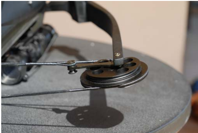
Unterseite der Umlenkrolle