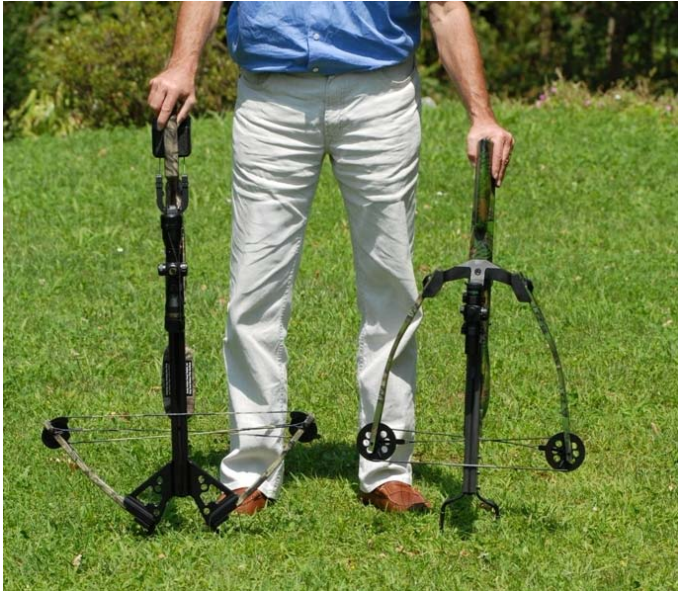
extrem kompaktes Design zur TenPoint Defender CLS

Das Design, neben einem völlig anderen Layout, ist sehr überzeugend: Der Schaft ist ästhetisch geformt, Verschraubungen sind nicht sichtbar; ein einzigartiges Merkmal bei der LEOPRO.