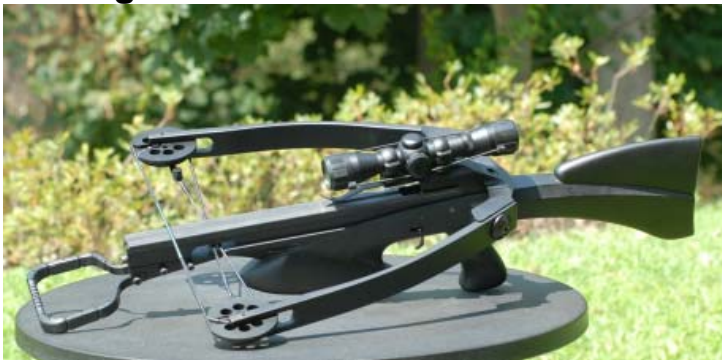
Die LEOPRO kommt komplett montiert incl. Zielfernrohr

Dank ihres Designs kann die LEOPRO montiert und komplett mit Zielfernrohr oder auch demontiert in einem Koffer mittlerer Größe transportiert werden. Dieser Aspekt ist in Ländern wichtig, die einen sicheren Transport im nicht fertigen Zustand vorschreiben, und dies erfordert bei konventionellen Armbrüsten oft schwerfällige und übergroße Koffer.