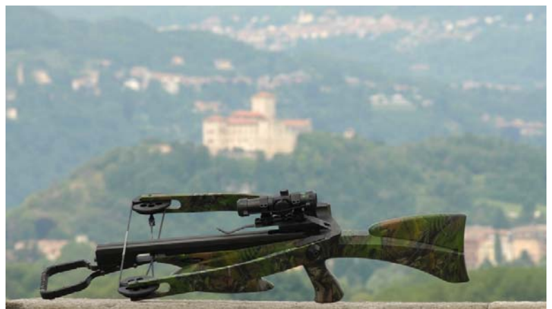
LEOPRO in Camoufla

Diese Armbrust ist wirklich erstaunlich, da sie Design mit revolutionärem Layout verbindet. Erschrecken mag anfangs ihre Form (das Wurfarm/Spanner-Setup wurde vollständig umgekehrt), bis Sie im weiteren Umgang erkennen, wie radikal anders sie ist. Sie ist in der Lage, einen neuen Maßstab für alle anderen zu setzen. Lassen sie uns sehen, warum.